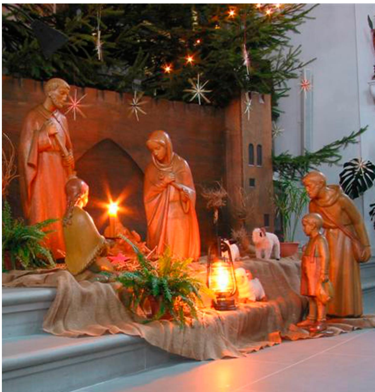
Foto Krippe Pfarrkirche Hergiswil